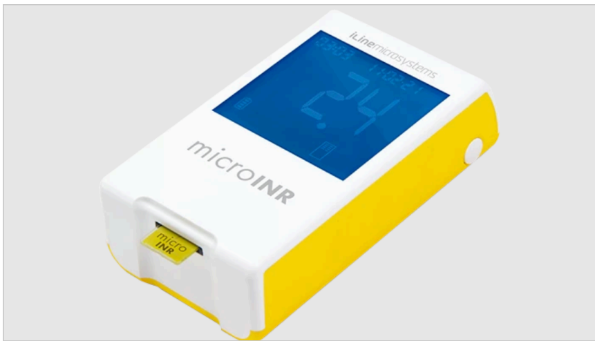
microINR måler fra Aidian