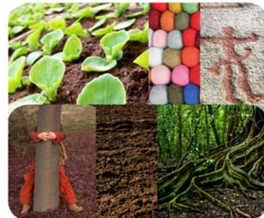
Barne- og ungdomssenteret